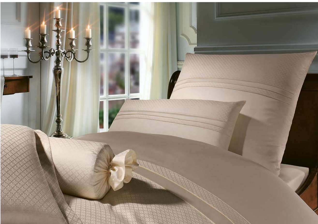
Elegant und pflegeleicht: unsere bügelfreie Bettwäsche Sanssouci

Waschen bei 60°C, trocknen im Tumbler bis „bügelfeucht“. Wäsche sauber ausstreifen und zusammenlegen. Am besten ein paar Stunden im Stapel ruhen lassen.