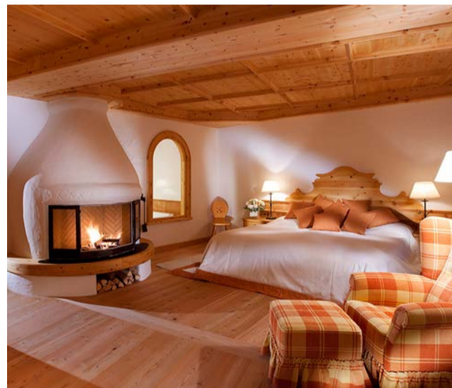
Beim Stanglwirt schwört man auf Schraml-Wäsche

Ganz einfach: Die Bettwäsche vom Schraml verzieht sich einfach nicht – das liegt an der aufwändigen Konfektion, und das spart Zeit, Geld und Nerven.