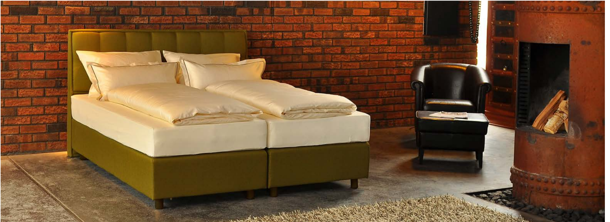
Hingucker: In den DormoMilani-Betten schläft der Gast wie auf Wolke sieben

Wie alle Produkte von Schraml sind auch DormoMilani-Betten aus sorgfältig ausgesuchten Materialien hergestellt. Zusammen mit den neuesten Erkenntnissen aus der Schlaforschung und unserer langjährigen Erfahrung ermöglichen sie Ihren Gästen einen wahrlich „traumhaften“ Schlaf.