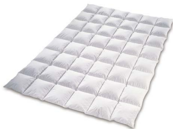
Daunendecke Estonia – Die ideale Hoteldecke

Eine Daunendecke aus heimischer Produktion in gewohnt guter Schraml-Qualität zu einem sensationellen Preis.