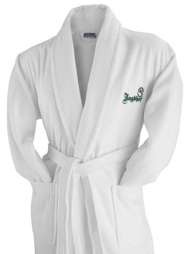
DuoStar: elegant und ökonomisch

Unser neuer Velours-Bademantel DuoStar ist ein echter „Star“ – leicht, haltbar, kuschelig, komfortabel, saugfähig und energiesparend.