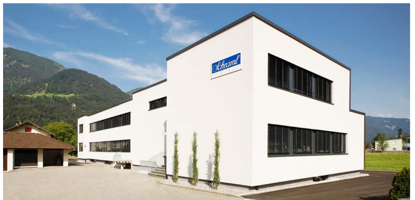
Dank der hauseigenen Näherei können individuelle Kundenwünsche erfüllt werden

Unsere Dienstleistung beginnt mit dem Besuch bei Ihnen vor Ort. Mit unserer umfangreichen Kollektion (Bettwäsche in über 50 verschiedenen Dessins und Tischwäsche in weit mehr als 100 verschiedenen Qualitäten und Farben) präsentieren wir Ihnen die gewünschten Muster in Ihrem Haus.