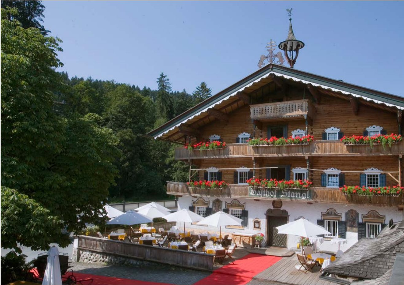
Der Stanglwirt in seiner malerischen Pracht ist ein Platz für alle, die das Besondere lieben.